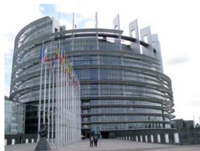
La Tour du Parlement à Strasbourg

En signant la pétition "One City", vous ferez un geste fort : celui de demander l'installation définitive du Parlement Européen à Strasbourg où bat le Coeur de l'Europe.