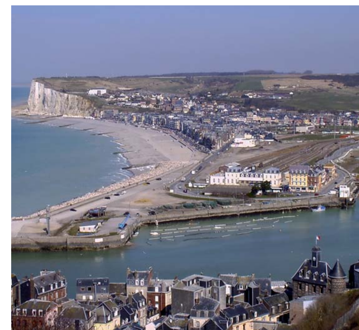
Les pêcheurs du Tréport, en Seine-Maritime (76), sont particulièrement concernés par la crise que traverse actuellement leur secteur.

Présidence de séance : Hans-Gert Pötering, Président du Parlement européen.