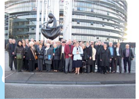
Strasbourg (67) 4