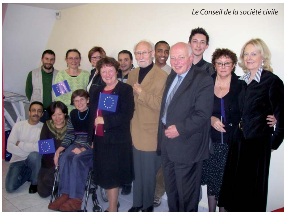
Le Conseil de la société civile