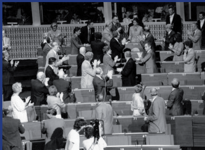
Le 17 juillet 1979 à Strasbourg, les députés européens se lèvent pour acclamer la Présidente qu'ils viennent d'élire : Madame Simone Veil.

Né en 1958, le Parlement vient de fêter ses cinquante ans. Un vrai jeune homme selon les standards d'aujourd'hui ! Son histoire est pourtant déjà riche et mouvementée.